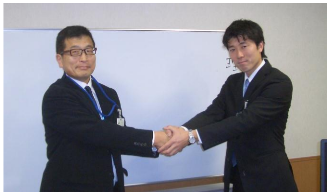
社長交代の瞬間 ～経営計画発表会にて～

形あるものが時代を超えて、次々と 世代交代しながら脈々と受け継が れていく、 その姿を目の当たりにしたひと時で した。